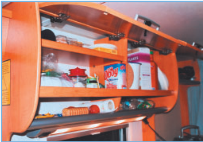
Hymeristä löytyy hyvin kaappitilaa mm. 9 ovellista ykäkaappia, 6 hyllyä ilman ovia.