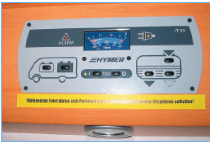
Yllä olevan mittariston avulla matkailija pystyy seuraamaan paljonko akuissa on virtaa sekä kuinka täynnä ovat vesi- ja harmaa vesisäiliöt.

kin talvella, on olemassa paljon ennakkoluuloja; kuten niitä oli myös ennen matkaa allekirjoittaneella. Suurin epäilyaihe oli että miten autossa voi talvella nukkua paleltumatta, etenkin kun lapsia on mukana. No se pelko tuli kumottua heti matkan alkuvaiheessa kun Oulussa yöpyessämme pakkasta oli yöllä -27 C eikä silti tarvinnut kuin tavallisen peiton päällensä. Silti kaasun kulutus pysyi mielestäni kohtuullisena sillä 11 kg:n pullo riitti noin kaksi ja puoli vuorokautta. Toinen lievää epäilystä herättävä aihe oli että miten käy vesien kanssa pakkasella ja varsinkin kun ajoviima vielä lisää kylmyyden purevuutta. Jälleen kerran Hymer osoitti talviominaisuuksiensa plussat vesiputkien pysyessä auki eikä edes harmaavesi säiliö jäänytynyt vaikka sitä ei matkan aikana tyhjennettykään.