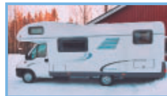
Pituutta autossa on seitsemän metriä.

Viikon matkailuautoilun jälkeen oli todella haikea tunne palauttaa autoa sillä viikko meni todella nopeasti ja ainakin toinen, ellei kolmaskin, viikko olisi varmasti mennyt nautinnollisesti kierrellen keväisen kaunista Suomea.