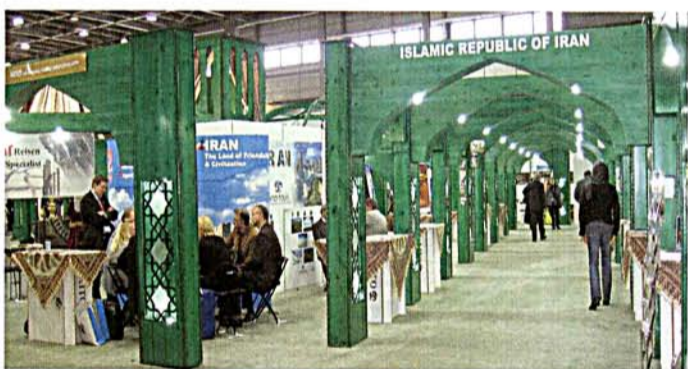
Hämärän vihreän Iranin osaston kuului tämänvuotuisen ITB:n erikoisimpiin tutustumiskohteisiin. Iranin matkailutarjontaa on esitelty myös Helsingissä Matkamessuilla.