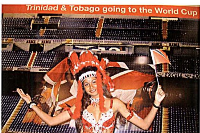
Saksan suurin matkailutapahtuma ensi kesänä ovat jalkapalloilun MM-kisat. Trinidad & Tobago juhli selviytymistään kisoihin vauhdikkaasti. Kyllä ITB:ssä osataan.